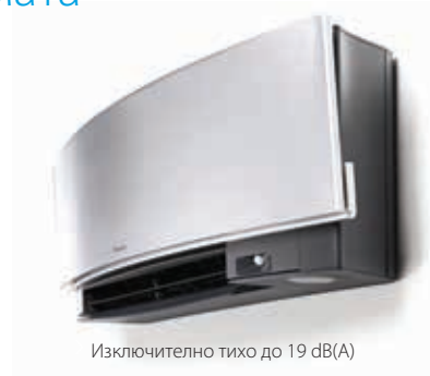
Изключително тихо до 19 dB(A)