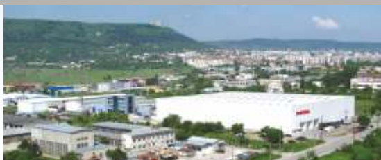
NES Ltd., Шумен, България

NES Ltd. е производител на изделия, използващи алтернативни източници на енергия. Фирмата е основана през 2002 година в гр. Шумен.