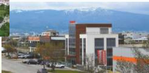
NES Ltd., София, България

NES Ltd. реализира своята продукция в Европа, Африка, Америка и част от Азия, като непрестанно разширява своите пазари.